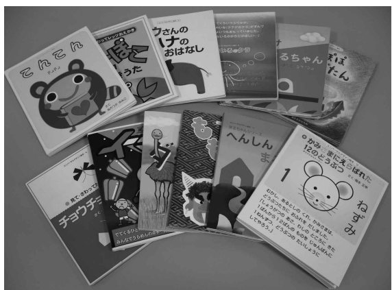
「ユニバーサルデザイン絵本シリーズ」 ・定価600円～800円（消費税別） ・大きさ：約（縦）190×（横）168×（厚さ）9mm

ん。まるちゃんが、さくら んぼや洋服のボタン、音符 などいろいろなものに変身 する。 主人公のまるちゃんが、 絵本の中でいろいろな変身 をしていく姿は、子ども達 にとって興味深く親近感が 湧くものである。 またこれらの絵本は、目 の見えない子ども達だけで なく、まだ字の読めない子 ども達にとっても楽しめる ものなので、多くの子ども 達と一緒に読むことができ るのもうれしい。